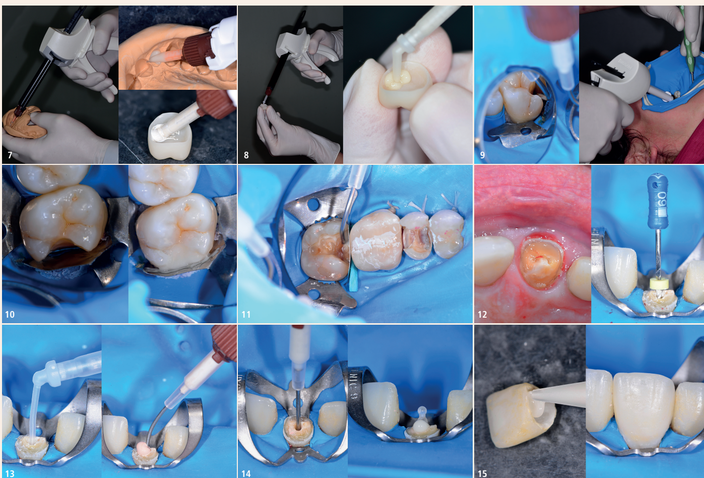
Abb. 7: Provisorisches Kronenmaterial wird mit dem S-Auslass an der Inzisalkante eingebracht, der provisorische Zement kann auch mit dem D-Auslass ohne Tip eingebracht werden. – Abb. 8: Die Applikation des Befestigungszements in einer Krone mit dem MIXPAC T-Mixer. – Abb. 9: Kanüle am Fundus der Kavität (links). Der Dispenser ermöglicht eine gute Übersicht und erlaubt eine zusätzliche visuelle Kontrolle mit dem Spiegel. – Abb. 10: Bei subgingivalen, tiefen Kavitäten ist es wichtig, diese mit einem chemischen Material homogen und luftblasenfrei von zervikal nach okklusal aufzufüllen. – Abb. 11: Blasenfreie Benetzung am Kavitätenboden mit einem Kompositzement für das Einsetzen eines Inlays. – Abb. 12: Epigingivale Kronenfraktur mit Pulpabeteiligung (links), Aufbereitung für eine Wurzelfüllung (rechts). – Abb. 13: Das Wurzelfüllungsmaterial wird mit MIXPAC T-Mixer (Auslass: rund) mit einem Tip (links) oder dem dünnsten MIXPAC T-Mixer Colibri (Auslass: Metallkanüle) eingebracht. – Abb. 14: Einbringen eines selbstadhäsiven, dualhärtenden Kompositzements und Applikation eines Glasfaserstifts. – Abb. 15: Blasenfreie Applikation von Stumpfmaterial in die bestehende Krone mit MIXPAC T-Mixer Mischkanüle mit D-Auslass.