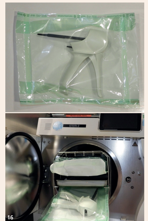
Abb. 16: Die MIXPAC Dispenser können nach dem Gebrauch einfach sterilisiert werden.

Um auch den künftigen gesetzlichen Vorgaben der Hygienevorschriften gerecht zu werden, kann der Dispenser nach jedem Gebrauch mit anderen Instrumenten zusammen sterilisiert und gelagert werden (Abb. 16).