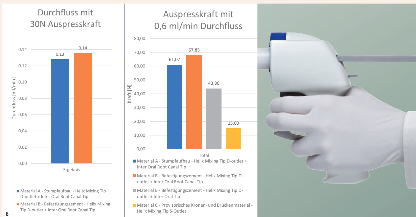
Abb. 6: Die kleinste Kraft, um die getesteten Materialien A und B auszutragen, beträgt rund 30 N, das ist bereits eine zu hohe Kraft, um längerfristig austragen zu können, und resultiert in einer sehr geringen Durchflussmenge. Bei einer geringen, aber akzeptablen Durchflussmenge steigt die benötigte Kraft auf über 60 N. Dieser Wert ist nahe der Maximalkraft und macht ein gleichmäßiges manuelles Austragen ohne Dispenser unmöglich.